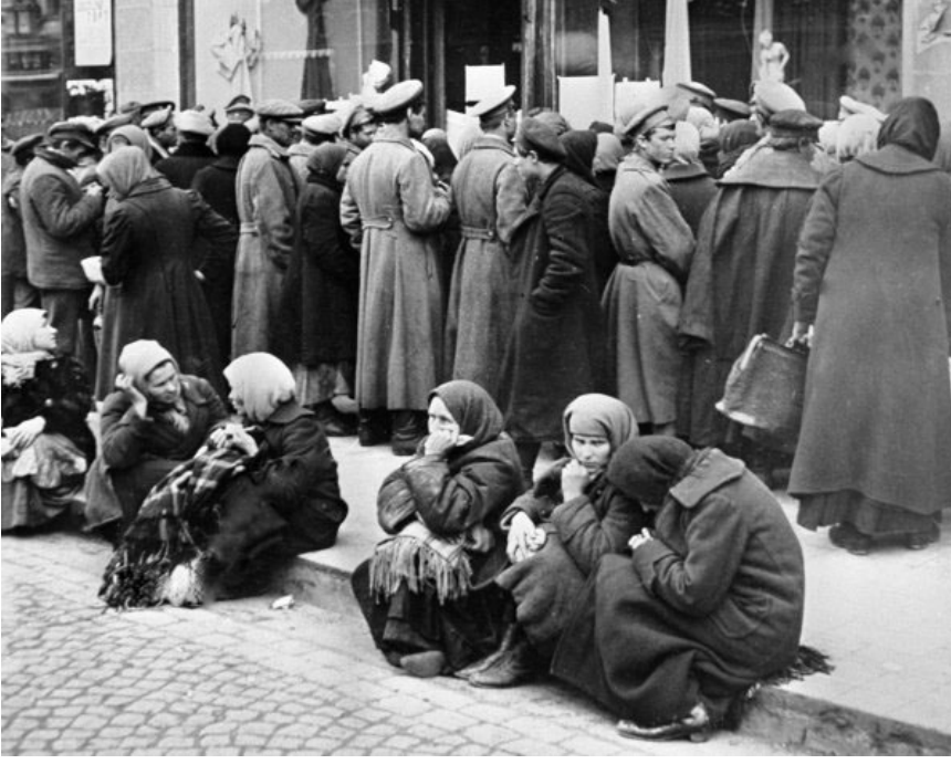
1917 kışında Petrograd ekme kuyruğu

lemi ile en ileri sanayi hamlesinin sonucu olan yeni üniversiteler, yabancı eserler, yeni bilimsel keşifler ve tekniklerin patlamalı bileşiminden doğacaklardı.