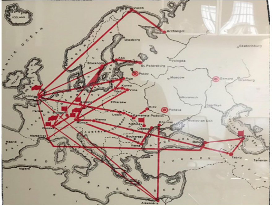
Iskra gazetesinin uluslararası dağıtım yolu haritası

Hedef, işçi sınıfının öncülerini yeni kavramlarla, araçlarla, taleplerle sürekli besleyerek, onları radikalleştirmek, eklemlemek ve kapitalizmden kopuş doğrultusunda örgütlemektir.