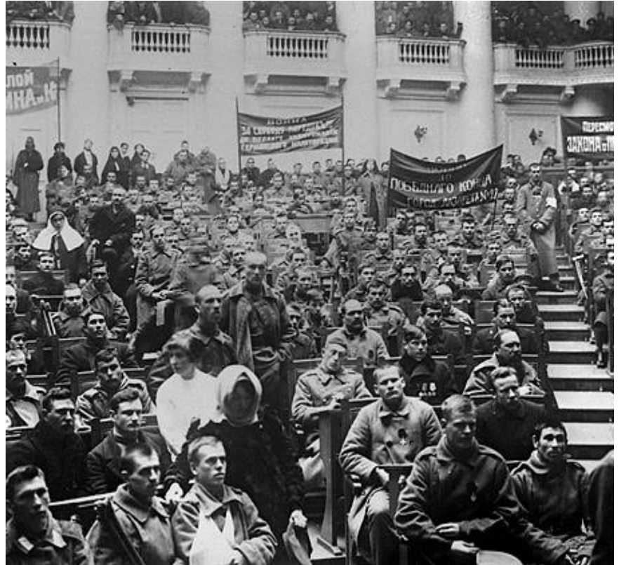
Petrograd işçi ve asker sovyeti toplantı halinde

Bu içgörü olmaksızın ne Üçüncü Enternasyonal'in kurulması ne de uluslararası sosyalist devrimi ilerletmek mümkün olamazdı.