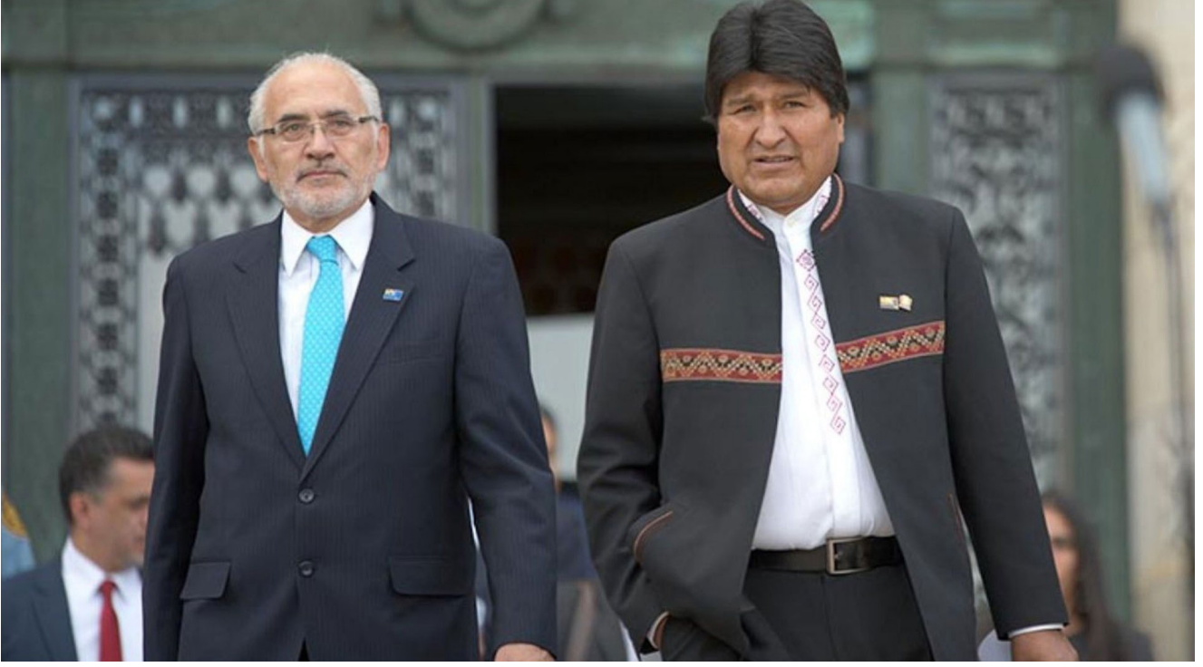
Carlos Mesa ve Evo Morales

seçimlerinde %20,9'luk oy oranıyla ikinci sırayı alan Evo Morales, kitlelerde 1982 yılında son bulan askeri diktatörlüğün arkasından gelen sağ-muhafazakâr iktidarlara karşı biriken öfkenin temsilcisi rolüne bürünüyordu. Nitekim, 2005 yılında Morales'in iktidara taşıyan dalga, kitlelerde doğal kaynakların talanı ve yerel halk kültürleri üzerindeki etnik ayrımcılığın son bulması yönündeki taleplerin ifadesiydi.