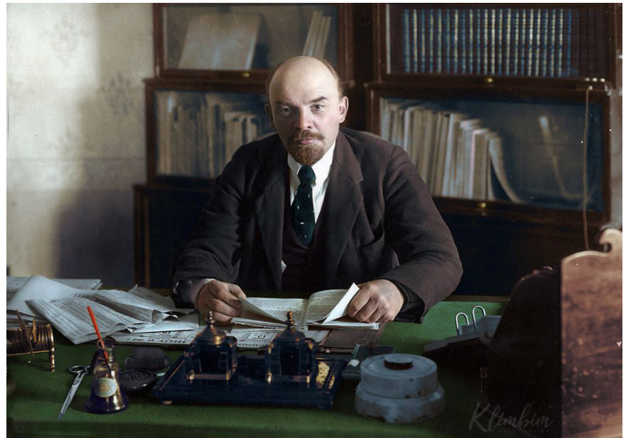
Vladimir İliç Ulyanov - Lenin

En zorlu koşullar altında bile, farklı görüşlerin ve eğilimlerin ortaya konduğu, temsilcilerin seçildiği gibi geri çağrılabilirdiği, üyelerine özgüven ve inisiyatif veren bir tür parti modelidir bu. Üyeleri yalnızca partinin politik